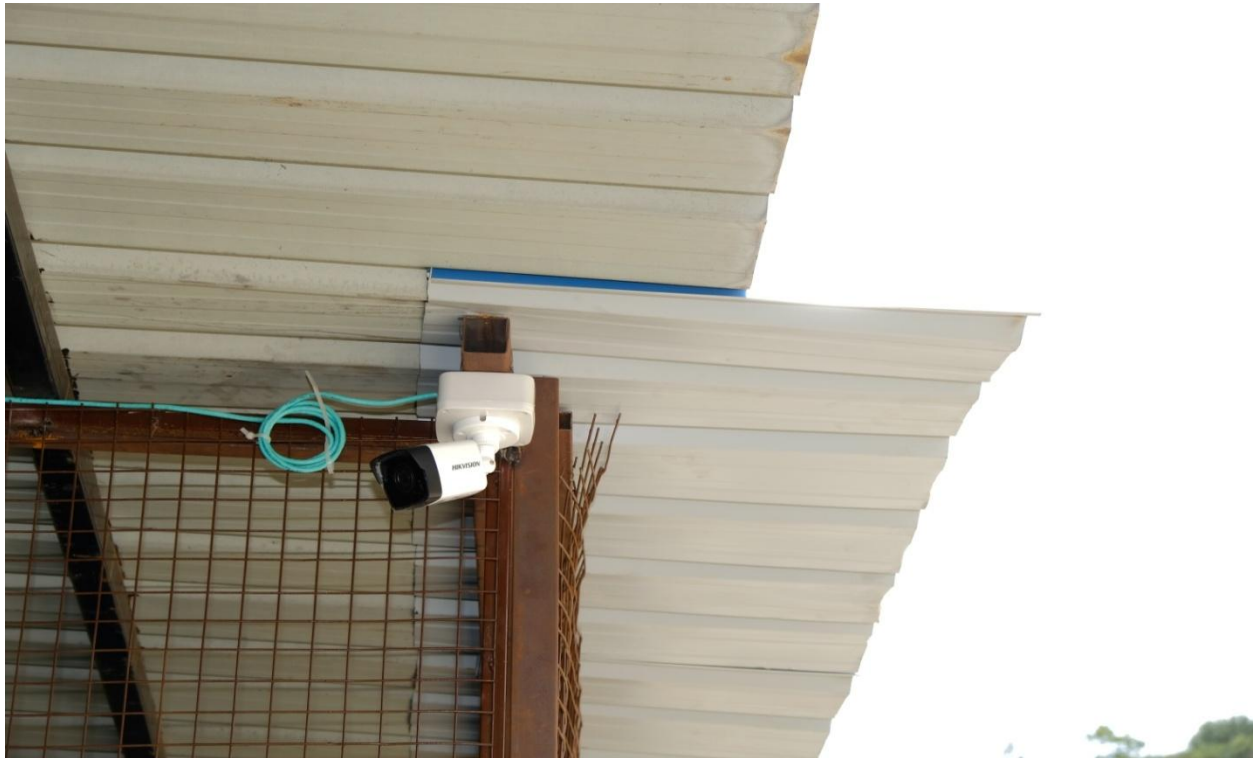
CCTV Camera near the College Office