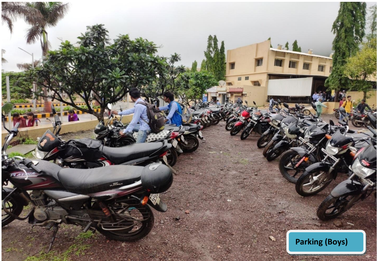
Separate Boys Parking