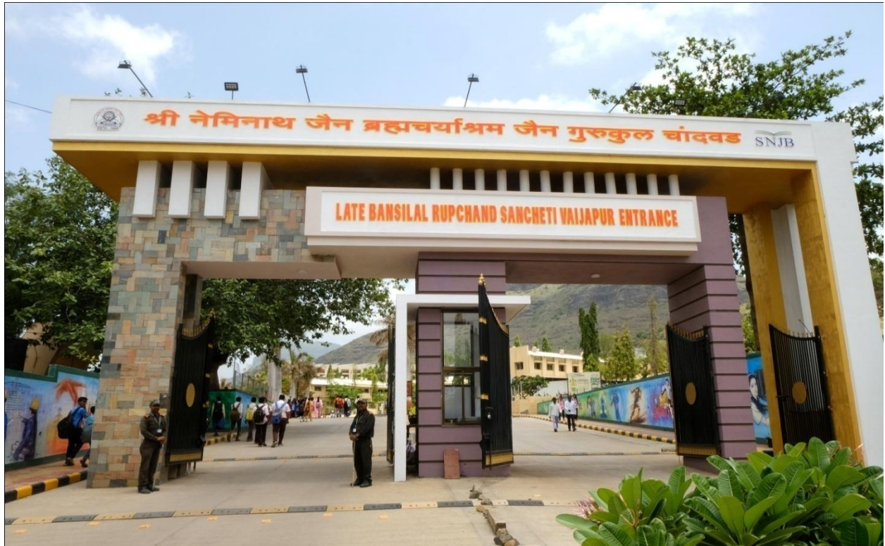
Security guard on the main gate of the College Campus