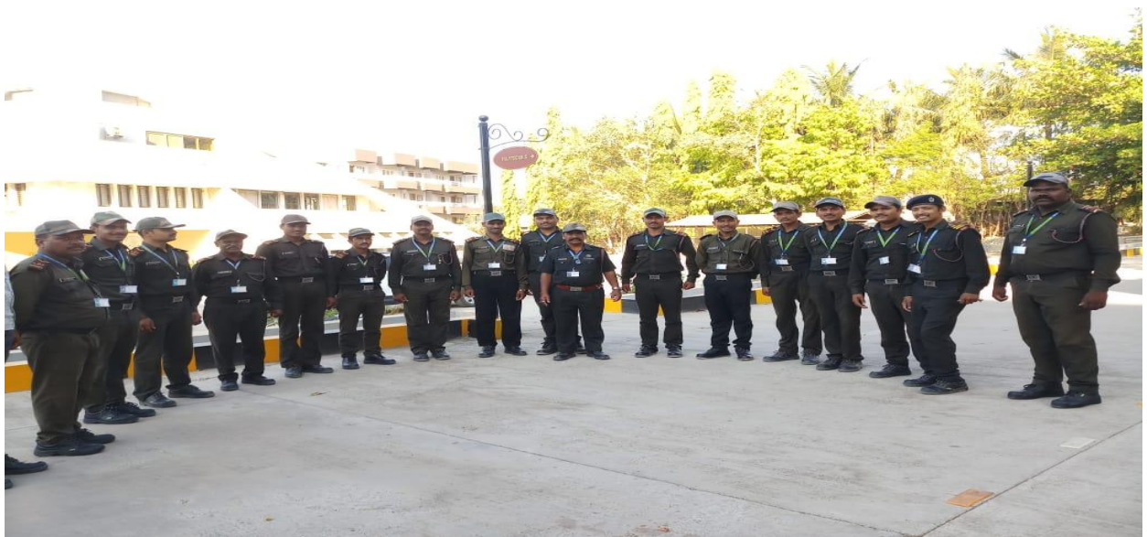
Security Guard Training in the Campus