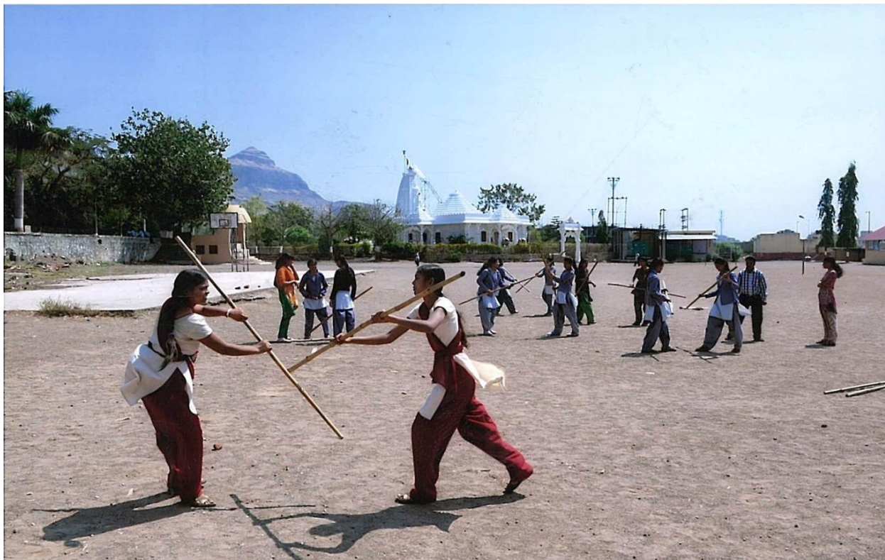
Self Defense Training