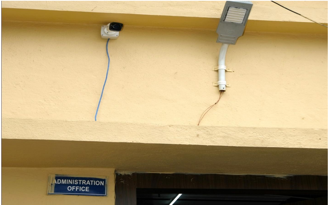
CCTV Camera outside the Administration Office of the College