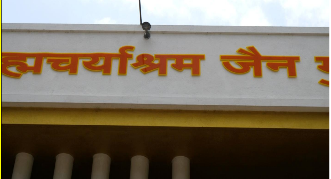
CCTV Camera at main gate of College Campus