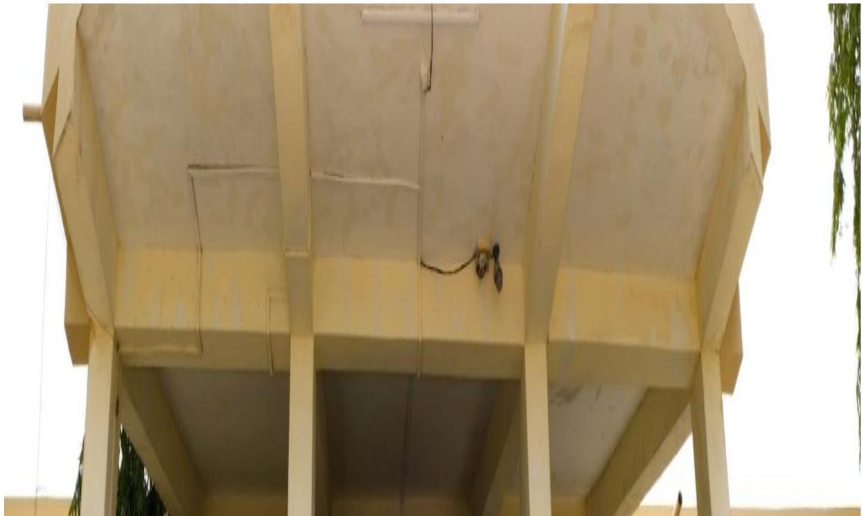
CCTV Camera at the Entrance of College