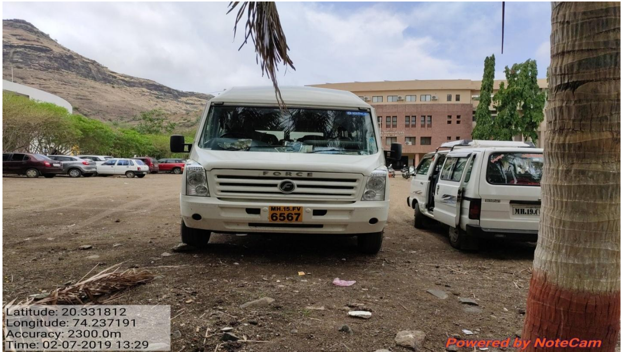
Transport Facility for Girl Students for Security Purpose