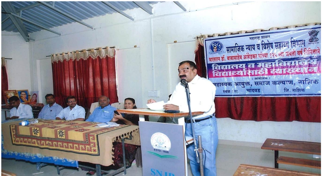
Counseling on Social Justice and Empowerment