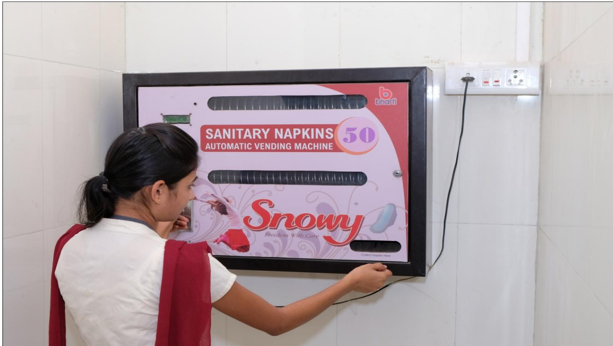
Sanitary Napkin Vending Machine