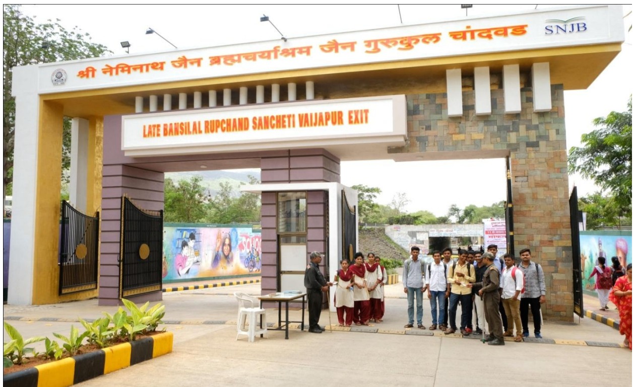
Security guard checking I-Card on the main gate of the College Campus