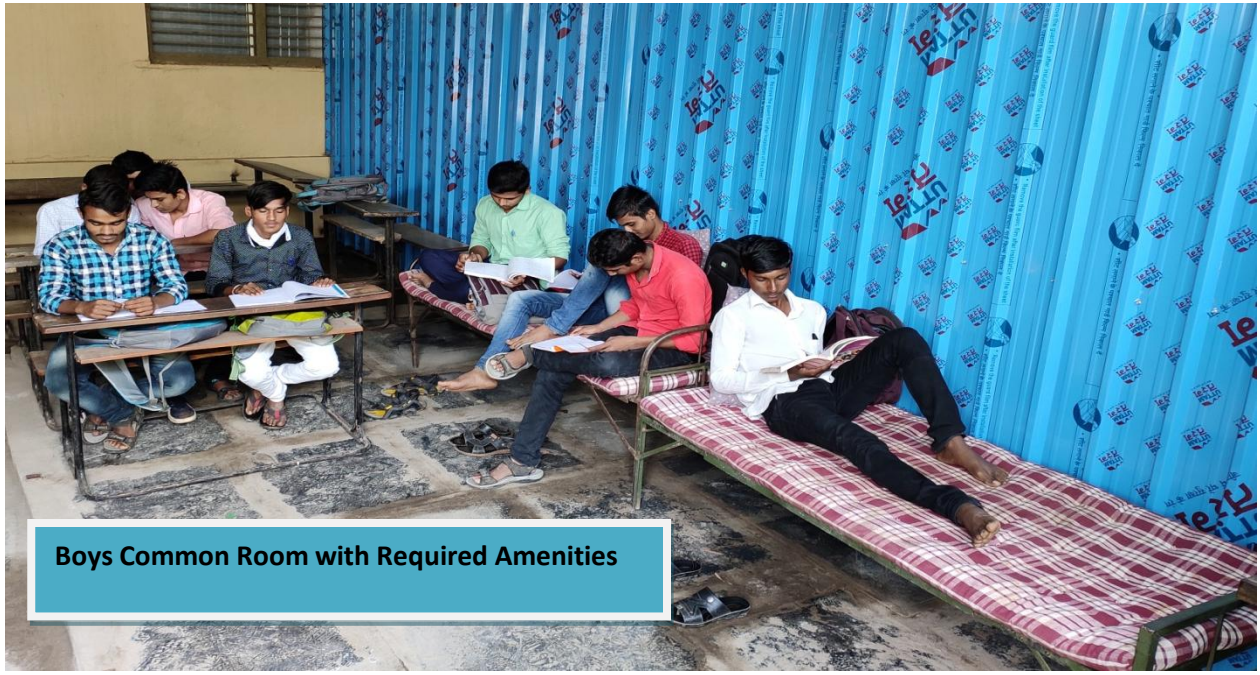
Boys Common Room