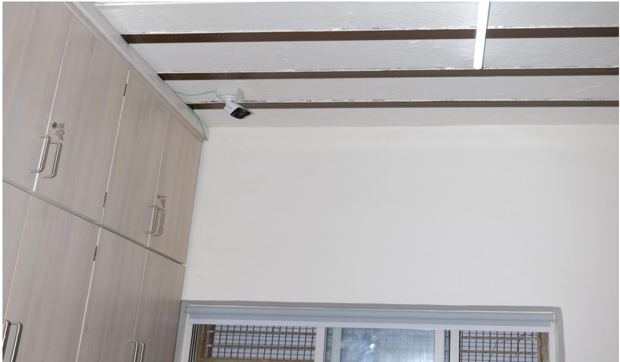
CCTV Camera in Administrative Office