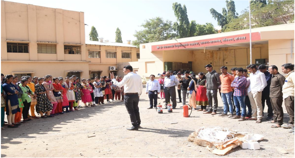
Laboratory Safety Training