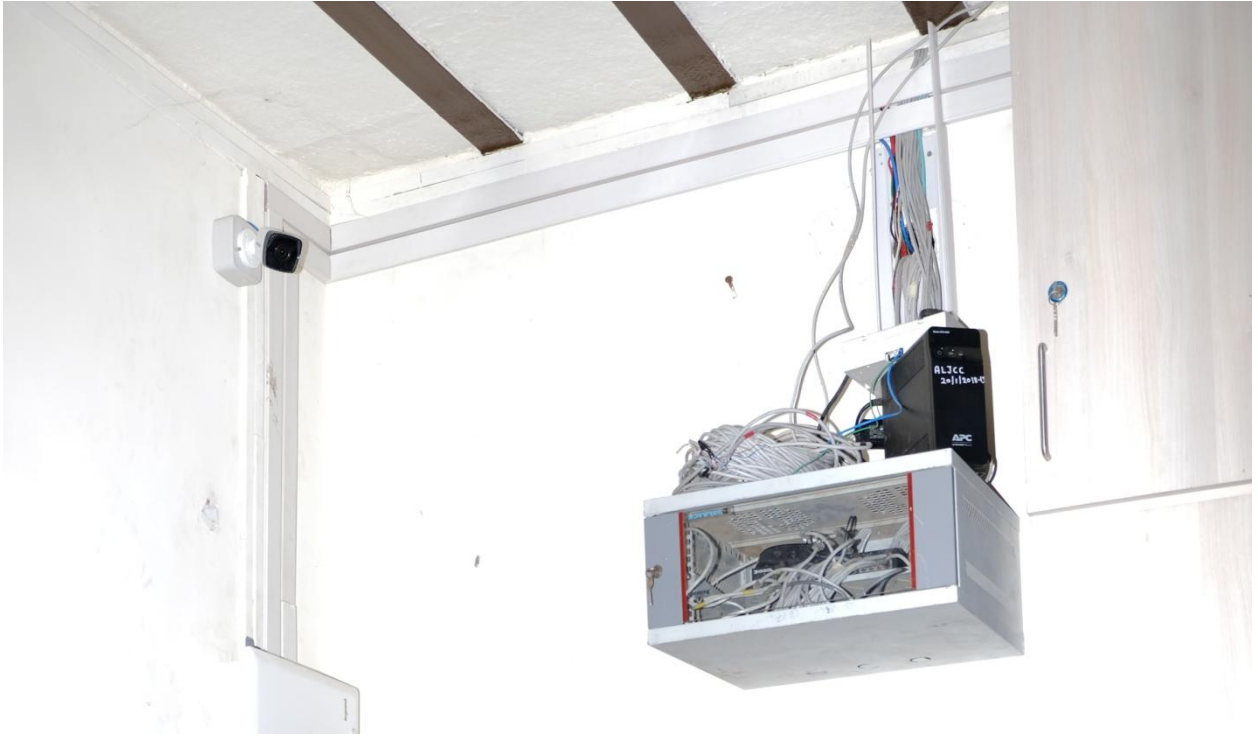
CCTV Camera in Examination Center