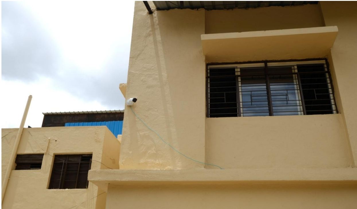
CCTV Camera behind the College