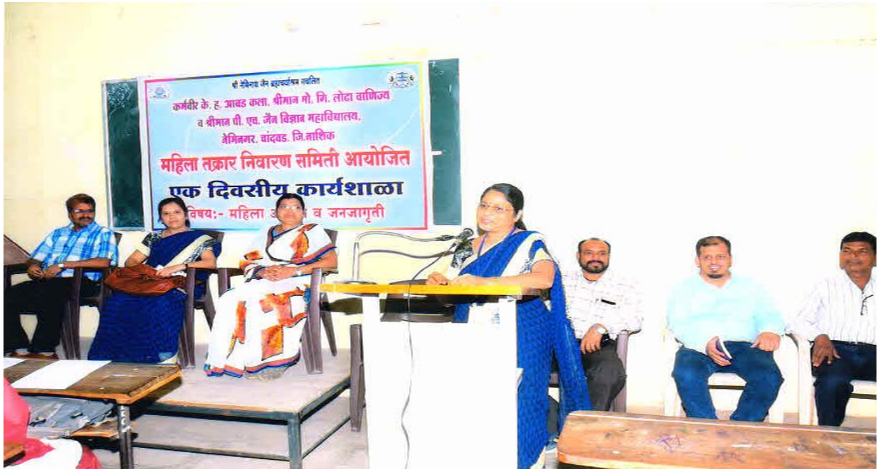
Workshop on Girl's Health Safety