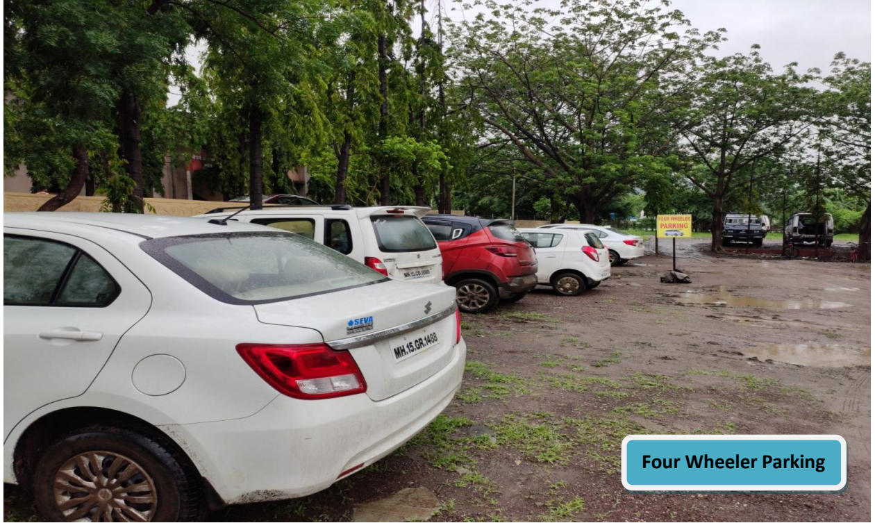
Four Wheeler Parking