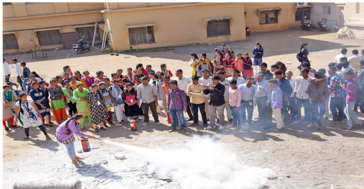
Laboratory Safety Training