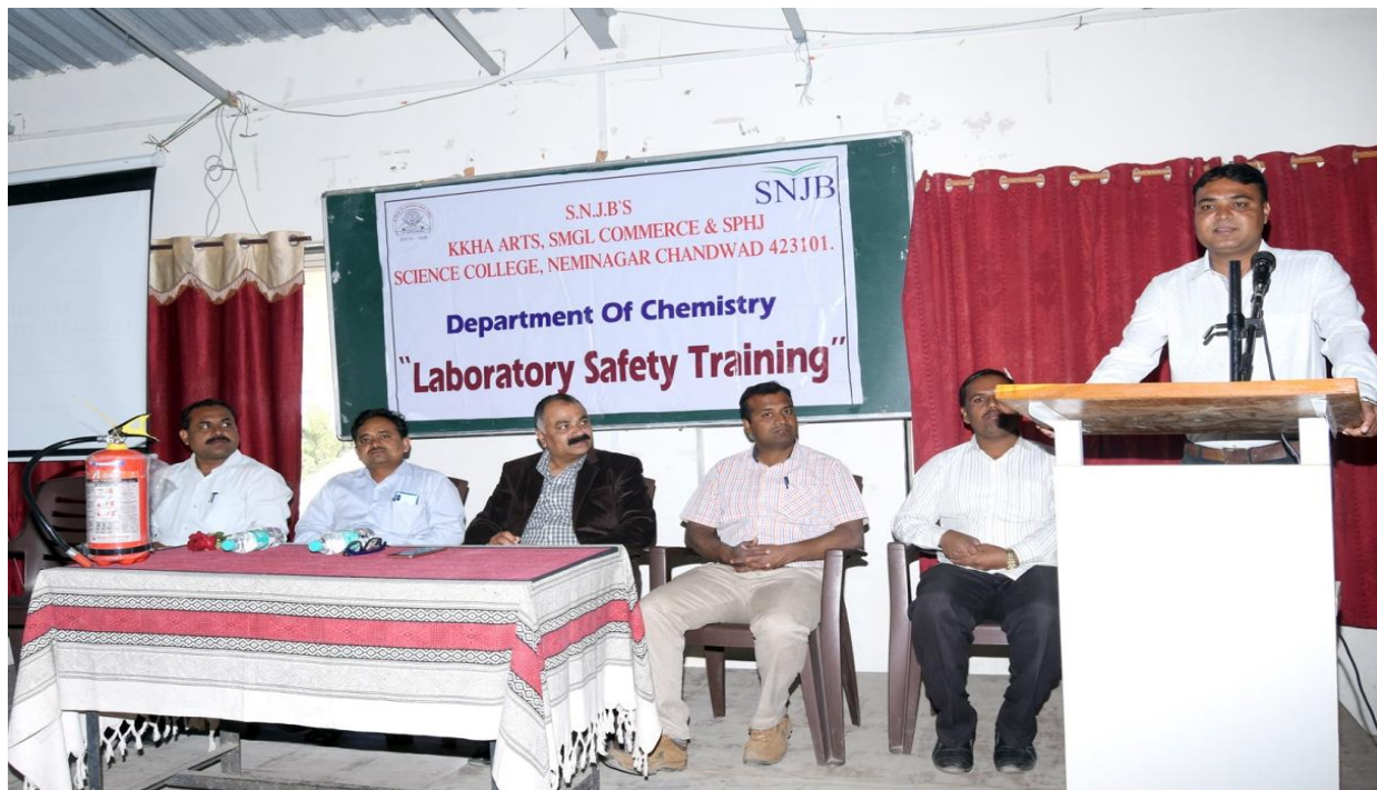
Laboratory Safety Training