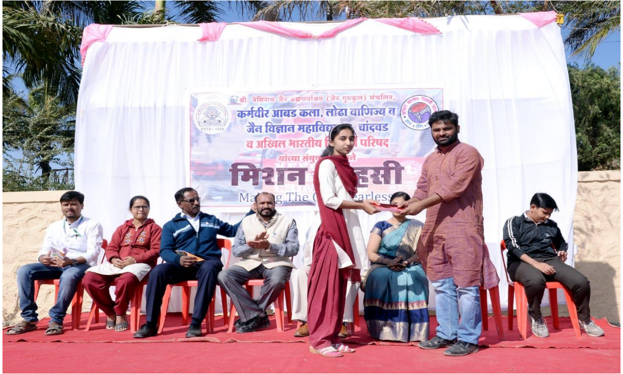
Mission Sahasi for Self Defense