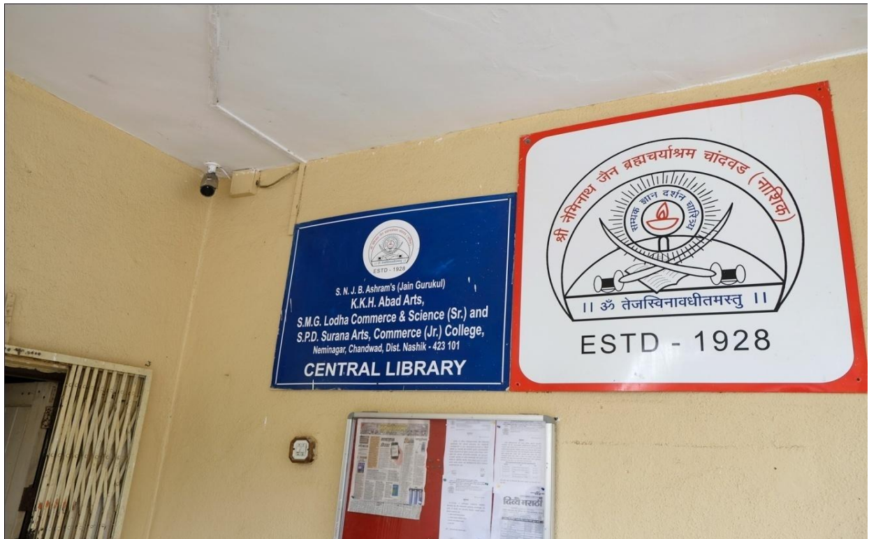
CCTV Camera at Library Entrance