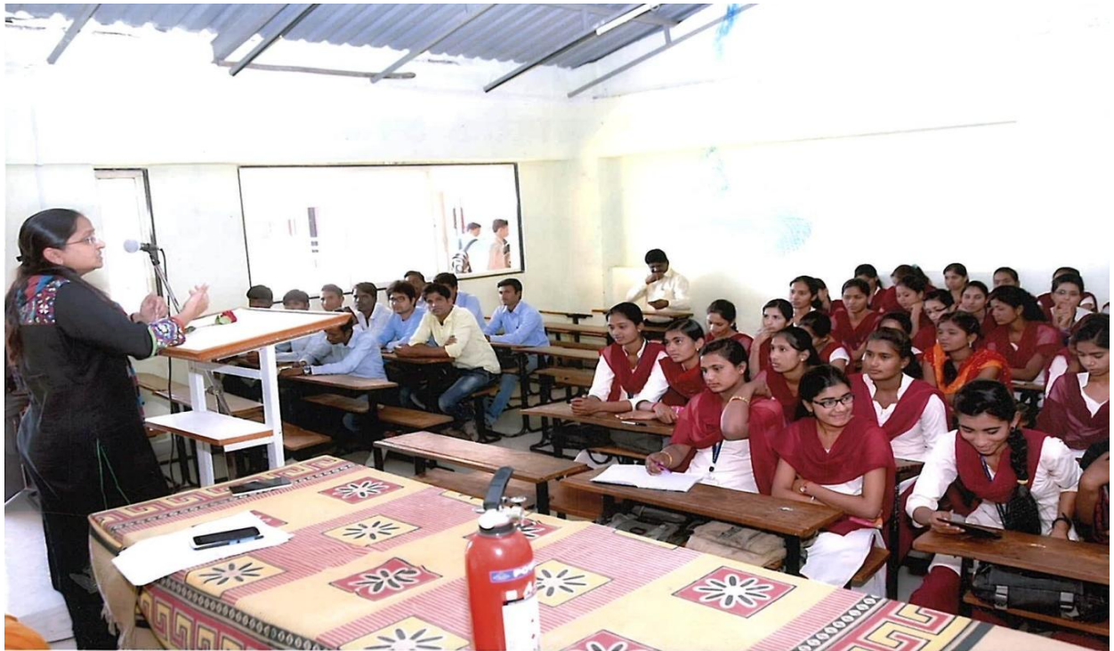
Workshop for Safety of Students