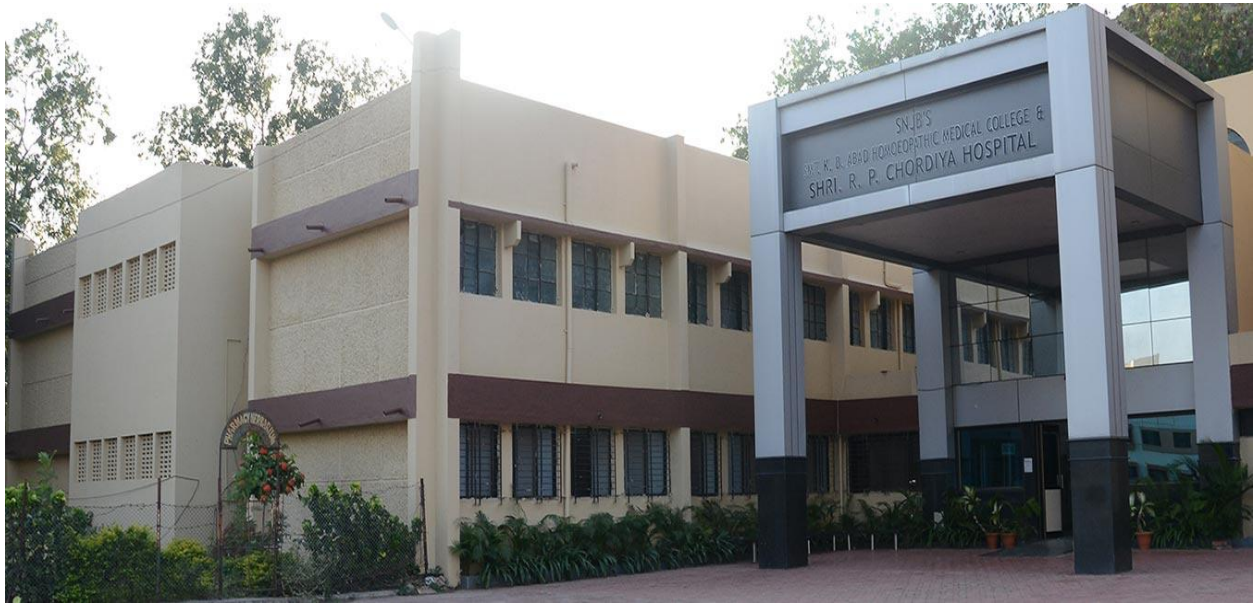
R. P. Chordiya Hospital