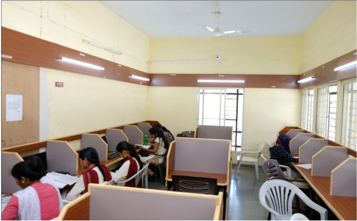
In Library Reading Room