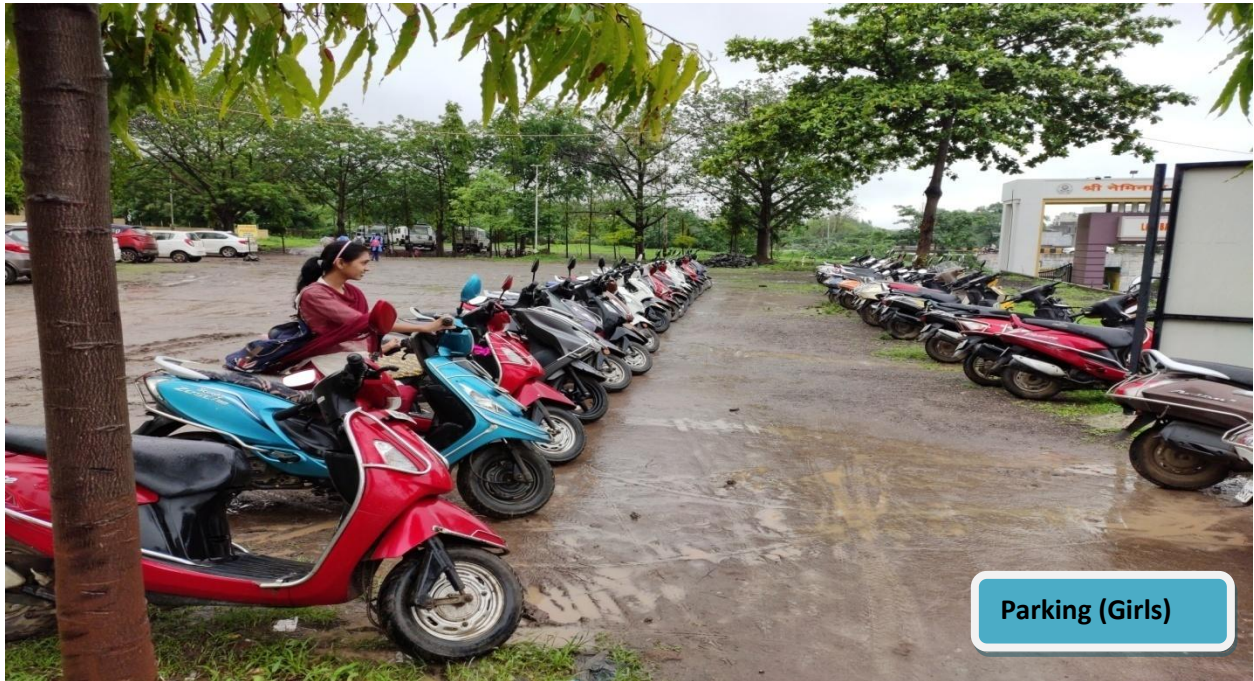
Separate Girls Parking